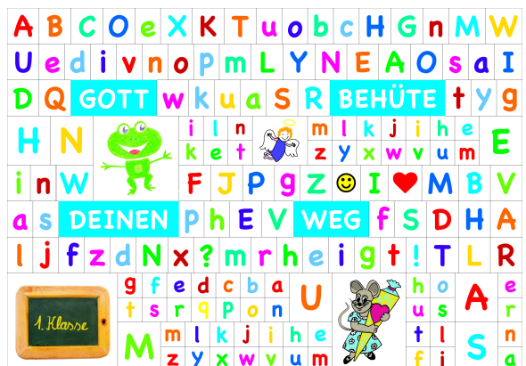
Evangelische Medienarbeit/EMA Kampagnen und Design

Den Gottesdienst begleitet der Kinderchor unserer Kirchengemeinde.